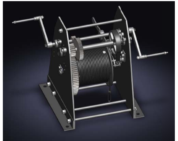
装置の3次元 CAD モデル