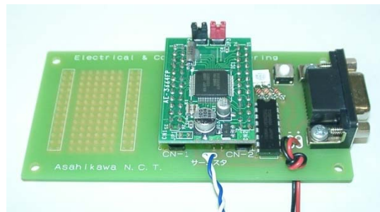
H8マイコンの実習回路

H8 マイコンに接続した外部回路をプログラムによって制御し、測定や動作をさせることができます。基礎を低学年の実験で、応用を卒業研究で行っています。